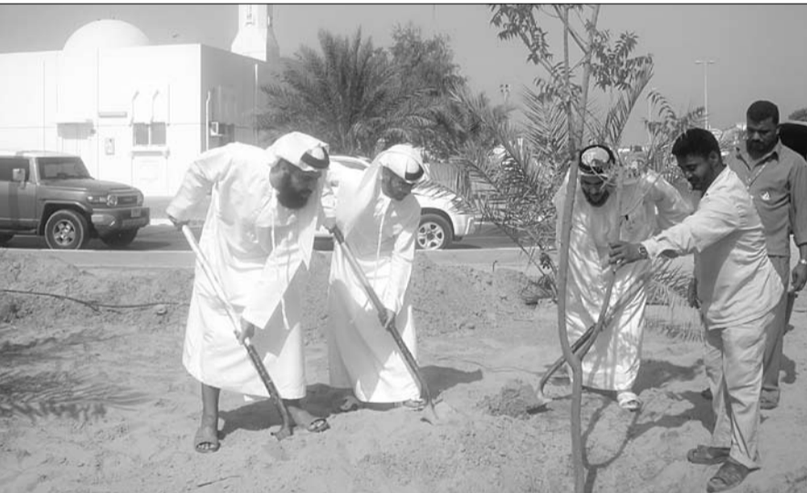
وأكد سمو وزير الخارجية حرص الجهات المعنية في الدولة على متابعة أمور طلبة الإمارات وتذليل الصعاب أمامهم لتتبع تحصيلهم العلمي والعودة لوطنهم مسلحين بسلاح العلم والمعرفة ليتمكنوا من الاسهام في مسيرة الخير والعطاء لوطننا الغالي في ظل قيادته الرشيدة. وخلال اللقاء أشاد سالم على طالب لفة بدور المنح الدراسية وأهميتها لاستكمال التعليم وأنه من خلال التجربة لم يكتب فقط تعلم اللغة الكورية وإنما اكتساب الثقافة الكورية الكاملة الداعمة للطلبة الإماراتيين والفرص التي تمنحها دولة الإمارات وقيادتها على دعمها للتعليم. من جهة أخرى التقى سمو وزير الخارجية مواطني الدولة الذين يتلقون العلاج في مستشفيات كوريا في إطار حرص قيادة الدولة على متابعة أحوالهم والتواصل مع جميع المواطنين أينما كانوا.

أعلنت جمعية أم المؤمنين بعجمان عن تنظيمها احتفالية يوم العلم الثلاثين والذي يتزامن مع ذكرى مرور ثلاثين عاما على انطلاق جائزة الشيخ راشد بن حميد التعميمي للثقافة والعلوم التي شكلت قاعدة الأساس لفعاليات يوم العلم وتنظمها سنويا جمعية أم المؤمنين تحت رعاية صاحب السمو الشيخ حميد بن راشد النعيمي عضو المجلس الأعلى للإتحاد حاكم إمارة عجمان وقرينته سمو الشخبة فاطمة بنت زايد بن صقر آل نهيان رئيسة جمعية أم المؤمنين رئيسة اللجنة العليا المنظمة لاحتفالات يوم العلم. حيث تحتفل إمارة عجمان يوم الخامس والسادس من شهر مارس المقبل بيوم العلم خلال حفلين منفصلين أولهما للرجال والثاني للنساء في استراحة الصفا بعجمان، جاء ذلك خلال المؤتمر الصحفي بحضور فضيلة المعيني رئيسة اللجنة الإعلامية، الدكتورة أمته خليفة آل على عضو اللجنة العليا المنظمة للاحتفالات، و نائبة مدير اللجنة الإعلامية والمشرفة على مشروع الزاهية، وذلك بمقر جمعية أم المؤمنين في عجمان للاجتماع عن برنامج حفل الرجال والنساء وقوائم أسماء الكرمين والكرامات. وتشهد احتفالية يوم العلم تكريم 111 من رواد المنظمة الاجتماعية في الإمارات والخليج، والقائمين بجائزة راشد بن حميد للثقافة والعلوم للدورة