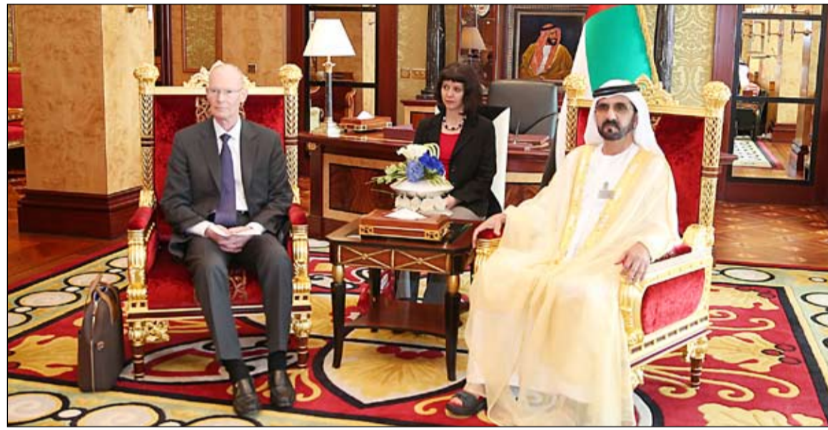
محمد بن راشد خلال استقباله رئيس وأعضاء وفد المكتب الدولي للمعارض

زار معرض جلفود واستقبل رئيس وأعضاء وفد المكتب الدولي للمعارض محمد بن راشد يؤكد اهتمام الإمارات وسعيها للفوز باستضافة دبي لإكسبو 2020 • دبي - وام: استقبل صاحب السمو الشيخ محمد بن راشد آل مكتوم نائب رئيس الدولة رئيس مجلس الوزراء حاكم دبي رعاها الله في قصر سموه بزعيميل ظهر امس بحضور سمو الشيخ مكتوم بن محمد بن راشد آل مكتوم نائب حاكم دبي والفريق سمو الشيخ سيف بن زايد آل نهيان نائب رئيس مجلس الوزراء وزير الداخلية وفد المكتب الدولي للمعارض ومقره العاصمة الفرنسية برئاسة السيد ستين كريستسن رئيس اللجنة التنفيذية في المكتب الذي يزور البلاد حالياً للاطلاع على الامكانيات المتوفرة لدى الدولة والتي تؤهل مدينة دبي لاستضافة معرض اكسبو الدولي 2020. وقد رحب صاحب السمو الشيخ محمد بن راشد آل مكتوم بالفرد مؤكداً اهتمام قيادة دولة الإمارات والجهات المسؤولة على المستويين الرسمي والشعبي بهذا الحدث العالمي نظراً لما يمثله من أهمية قصوى في بناء جسور التواصل الثقافي والانساني بين شعب الإمارات وشعوب المنطقة العربية وشعوب العالم. وأشار سموه في معرض تبادل وجهات النظر بينه ورئيس الوفد الدولي السيد كريستن الى أن دولتنا تمثل دول المنطقة في سعيها لكسب التأييد الدولي في التصويت لمدينة دبي لتكون المدينة المضيفة للمعرض الذي يعد الأبرز والأكبر والأهم على مستوى المعارض الدولية التي تقام في العديد من الدول وذلك لأنه يجمع تحت مظلتها ثقافات متنوعة وأعراقاً من كل لون. (التفاصيل ص 2)