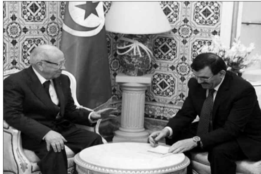
العريض يستقبل السبسي زعيم نداء تونس

والعمل الوطني الديمقراطي إلى عقد مؤتمر وطني للإلتقاء بتفعيل مبادرة الاتحاد العام التونسي للشغل دون إقصاء. جملة هذه المواقف تبرز بجلاء تخندق اللابعين الأساسيين في الساحة السياسية التونسية في مواقعهم، وتشير إلى أنّ خارطة المشهد لم تتغير وإن التوقيع الحزبي هو ذاته، ممّا يؤكد أنّ التحوير الوزاري المرتقب والحركية السياسية التي واكبته لم ولن تغير المشهد السياسي في تونس في العمق، وأنّ الوقت الذي استنزف في هذه العملية كان هدراً ولم يحقق الهدف الاستراتيجي منه، خاصة إذا ما أدركنا أنه حتى تحوّل الترويكاً إلى ائتلاف خماسي أو سداسي لا يعني الكثير، فهو تحوّل شكلي في الخارطة بما أن التلحين بالترويكاً هم في الغالب فروع من الأصل، مثل حركة وفاء التي هي منشقة عن حزب المؤتمر، بمعنى آخر إنّ ما حدث هو تنوع على نفس الوتر... وإذا كانت الحالة كما وصفتها، هل يمكن للمعارضة إسقاط حكومة على العريض المرتقبة؟ يجمع المراقبون، على أنّ إسقاط حكومة على العريض المقبلة يسبق رهين حزبي التكتل من أجل العمل والحريات والوئتمر من أجل الجمهورية. إذ أنّ هذين