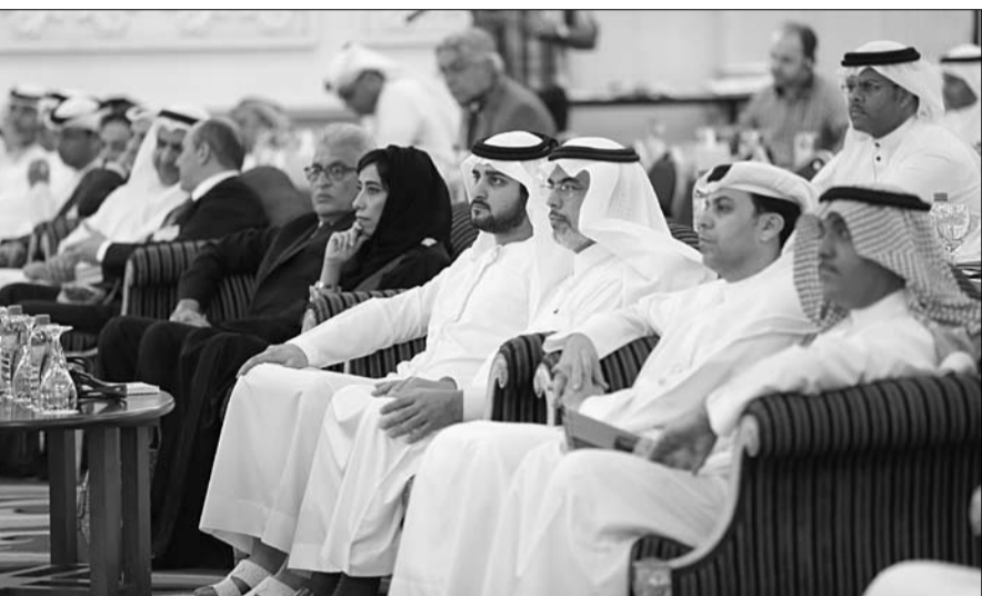
المعايير العالمية في قطاع النشر الصحفي وأثرها في الارتقاء بالآداء والخدمات إلى أعلى مستويات رضا المتلقي.

النشر مسؤولة أكبر ويفرض عليها البحث عن البدائل الكفيلة بتكفيها من القيام بالدور المتوقع منها كشريك في بناء المجتمع. ويتناقش المؤتمر على مدى جلساته الممتدة حتى الأول من مارس المقبل عددا من القضايا الحيوية المتعلقة بصناعة النشر في مقدمتها فرص النمو في مجالات النشر للصحف والمجلات وسوق الإعلان المطبوع والبحوث والدراسات في مجال وسائل الإعلام المختلفة والمجلات والصحف الإلكترونية والنشر الإعلامي في منطقة الشرق الأوسط. وقال جاكوب ماثيوز رئيس الرابطة الدولية للنشر والصحف وناشري الأنباء وان أيضا إن الصحف المطبوعة