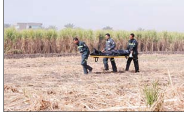
رجال الإنقاذ يخلون جثامين القتلى من موقع سقوط المنطاد

مقتل 19 سائحاً بسقوط منطاد في مصر • الأقصر - أ.ف.ب: قرر محافظ الأقصر وقف كل رحلات المنطاد السياحي بعد الحادث الدامي الذي اودى بحياة 19 شخصاً على الأقل أغلبهم سياح غربيون واسيويون في انفجار منطاد كان يحلق فوق منطقة الأقصر التاريخية في جنوب مصر، في حادثة تسجل أكبر حصيلة للقتلى منذ حوالي عشرين عاماً. وقال مصدر امني ان 19 شخصاً قتلوا من بينهم تسعة من هونغ كونغ وأربعة يابانيين وثلاثة بريطانيين وفرنسيين اثنين. ولم يستطع هذا