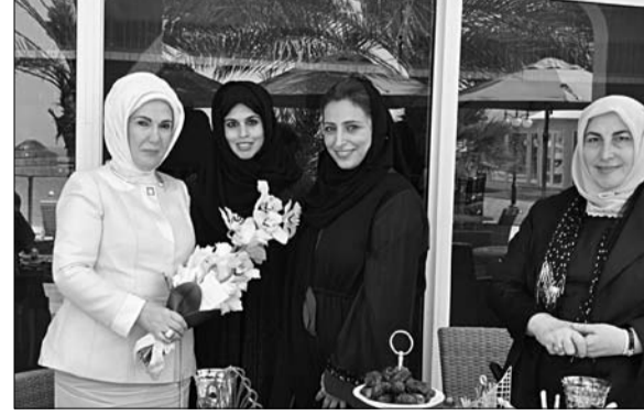
بدور صاحب السمو الشيخ زايد بن سلطان آل نهيان رحمه الله كونه مؤسس هذه الدولة والداعم الأول لحقوق المرأة، وقالت الشيخة زايد رحمه الله فتح المجال أمام المرأة للعمل وأعطاهما كامل حقوقها حيث قام بالمساواة بين الرجل والمرأة، وأنه دونها الآن لنكمل هذه المسيرة وخدمة الوطن دين علينا، وضمان

تلبية رغبات المجتمع وإعطاء كل فرد حقه، مؤكدة على أن المرأة في دولة الإمارات لديها حق المشاركة في كافة المجالات. وأضافت سموها أشعر بالفخر للقول بأن دولة الإمارات متمسكة بدينها الإسلامي وتراثها وثقافتها برغم تطورها على الصعيد العالمي. وعلى صعيد متصل قامت قرينة رئيس وزراء تركيا، بزيارة العالم السياحية والتراثية في قلب الشارقة ونادي سيدات الشارقة، ورافق الضيوف خلال الزيارة سعادة الشبيخة بدور بنت سلطان القاسمي، وسعادة الشيخة حور بنت سلطان القاسمي، ونورة النومان مدير عام المكتب التنفيذي للشيخة جواهر القاسمي وخولة جاسم السركال مدير عام نادي سيدات الشارقة. وشمل جدول جولة السيدة تركيا الأولى في الشارقة زيارة سوق العرصة في مشروع قلب الشارقة،