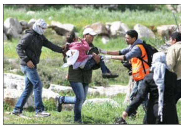
فلسطينيون ينقلون طفلة أصيبت باختناق من قنابل الغاز خلال اشتباكات بالضفة

الأمم المتحدة تحذر من تلاشي حل الدولتين كيري: أوباما لن يطرح خطة سلام في الشرق الأوسط • عواصم - وكالات: حذر منسق الأمم المتحدة لعملية السلام في منطقة الشرق الأوسط روبرت سيرى إن حل الدولتين - فلسطين وإسرائيل - أخذ بالتلاشي. وقال سيرى في مقابلة أجرتها معه صحيفة هارتس ونشرت امس إن العام القريب سيكون عاماً مصيرياً، وعلى الجميع أن يعلم أنه في حال عدم نشوء أفق سياسي مشوق لحل الدولتين فإن هذا الأمر قد يؤدي إلى نتائج خطيرة جداً. وأشارت الصحيفة إلى أن المقابلة مع سري جرت الأسبوع الماضي وعبر الأخير عن قلقه من قسقه من تقارير تحدثت عن اتساع إضراب الأسرى الفلسطينيين في السجون الإسرائيلية عن الطعام وموجة التظاهرات في الضفة الغربية. وقال سري بإمكان قضية الأسرى دائماً أن تؤدي بسهولة إلى أمور خطيرة، وقد عبر الأمين العام للأمم المتحدة (بان كي مون) عن قلقه أمام تفتياها. ومن برلين قال جون كيري وزير الخارجية الأمريكي امس ان الرئيس باراك أوباما لن يعرض خطة سلام على إسرائيل والفلسطينيين الشهر المقبل لكنه يعتزم ان يصغي. وأشارت جولة أوباما المنتظرة لوفعات بدفعة أمريكية جديدة لاحياء المفاوضات الإسرائيلية الفلسطينية التي توقفت منذ عام 2010 بسبب التوسع الاستيطاني. لكن كيري الذي كان يتحدث الى طلاب في المانيا خلال أول رحلة له في الخارج بعد تولي الخارجية الأمريكية هون من هذه التوقعات. وقال كيري لن نذهب ونطرح بقوة خطة ونقول لكل ما عليهم ان يفعلوه. أنا أريد ان أتناول الرئيس ويريد ان يصغي. وكان أوباما قد جعل قرار السلام بين الاسرائيليين والفلسطينيين من أولوياته في فترته الرئاسية الأولى لكن بعد أربع سنوات لم