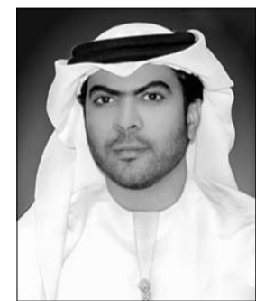
بين المهيري أنه سيتم يوم الاثنين الموافق 4 مارس إعلان نتائج جائزة عجمان للزراعة في حفل رسمي يقام تحت رعاية سمو الشيخ راشد بن حميد التعميمي رئيس الدائرة

ويحضر معالي وزير البيئة والمياه في المركز الثقافي لوزارة الشباب والرياضة وخدمة المجتمع في منطقة الجرف إضافة إلى وضع حجر الأساس لمشروع حديقة غرفة تجارة وصناعة عجمان، وسيتم في يوم الثلاثاء افتتاح مشتل زراعي في مدرسة الحميدية للتعليم الأساسي. و يوم الأربعاء سيتم افتتاح مشتل ثان في مدرسة عمر بن عبد العزيز، وزراعة شجرة الإتحاد في القرية التراثية في منطقة النمامة ثم توزيع أشجار النخيل على مساجد النمامة وكذلك في منطقة مصفوت وتوزيع شلات شجرة الإتحاد في المنطقة لزراعتها في الساحات والحدائق